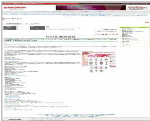
導入をプレスリリース!!

プレスリリース（掲載メディア約20）を利用して、グリーンサイトライセンスを導入した事をPRすることができます。複数のメディアに掲載されるので、自社の認知度向上につながります。