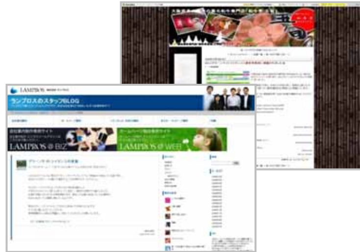
ブログ活用掲載例