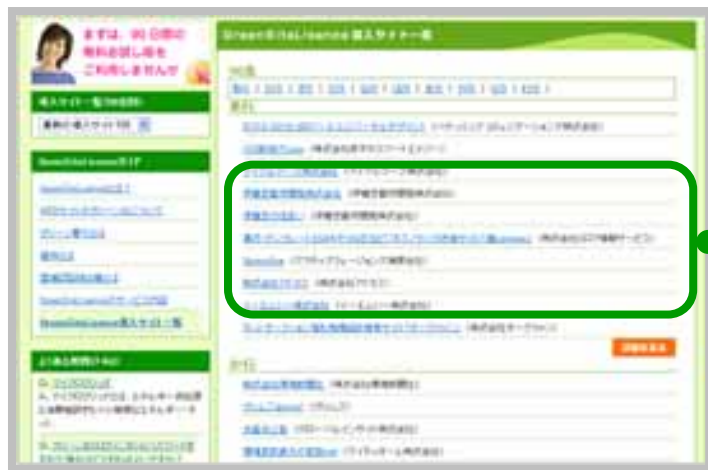
【導入サイト一覧】ページ

「導入サイト一覧」ページに導入したサイト名と企業名を掲載し、リンクを張る事ができます。 有料版をご購入いただいたサイトのみ掲載させていただきます。